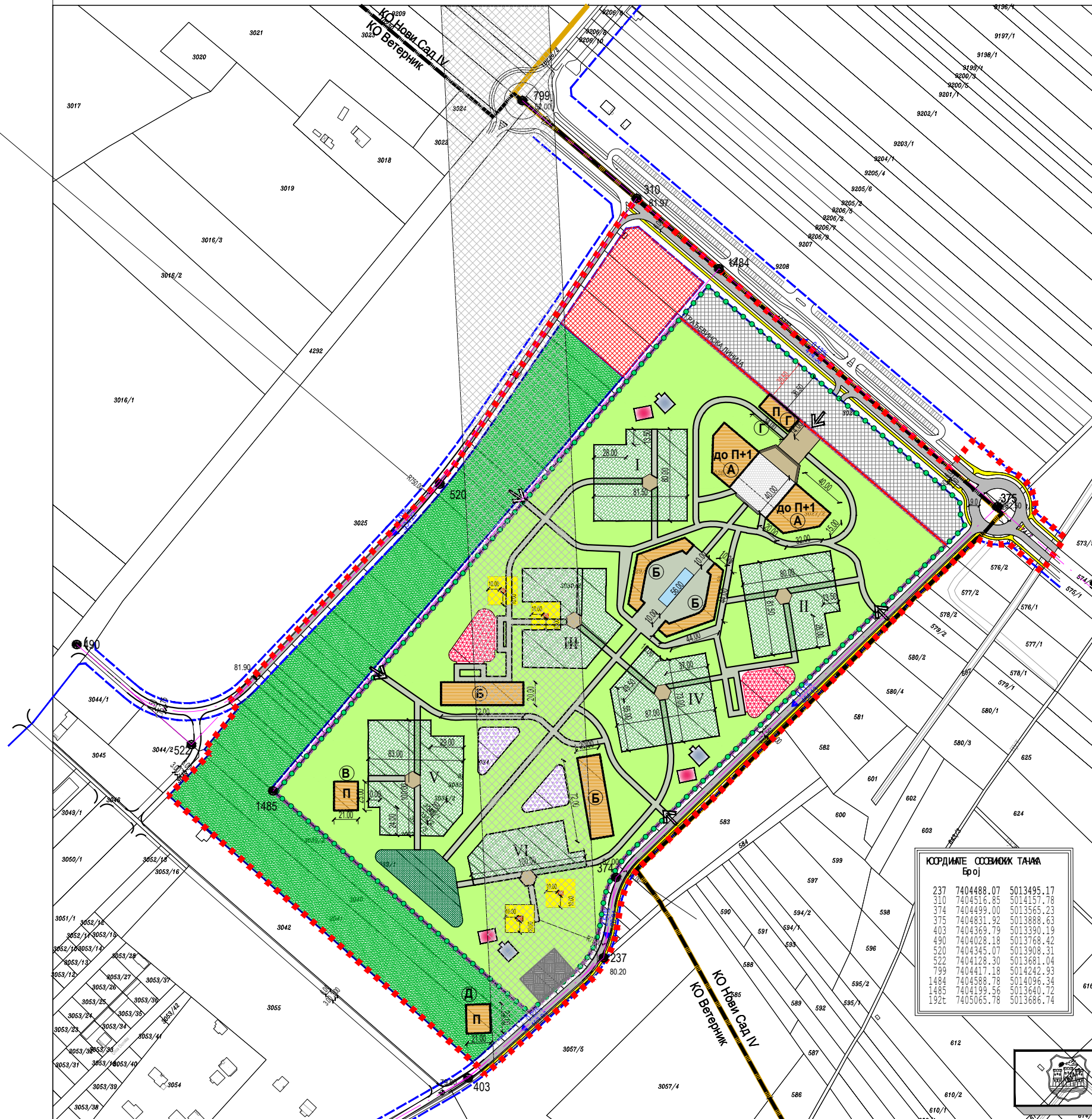
НАМЕНА ПОВРШИНА И ПОДЕЛА НА КАРАКТЕРИСТИЧНЕ ПОТЦЕЛИНЕ

ПЛАН НАМЕНЕ ПОВРШИНА, САОБРАЋАЈА, РЕГУЛАЦИЈЕ И НИВЕЛАЦИЈЕ